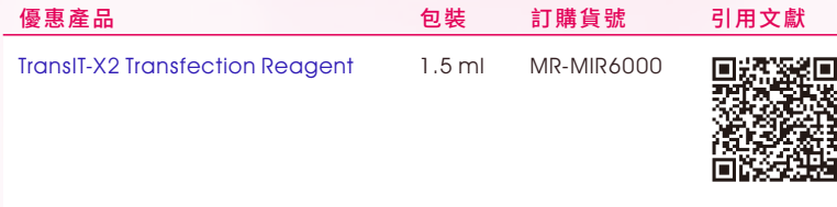
TransIT-X2 ® 轉染效率遠高於他牌產品，並且毒性低微！