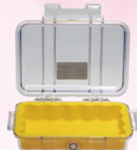
Olaf Humidifying Chamber